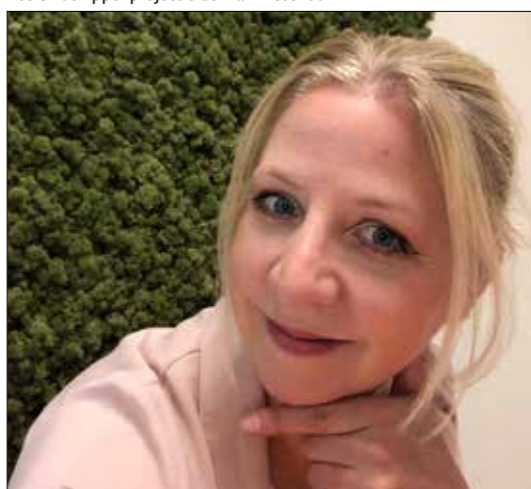
Romy Oujjit Impuls Kinderopvang